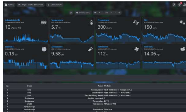
Prezentacja danych w postaci dashboard.

danych - ostatnie 6h, 12h, 24h, 48h, 72h, tydzień lub miesiąc. Prezentacja danych historycznych zawiera również aktualny trend, wartość aktualną, wartość minimalną, średnią oraz maksymalną. Prezentowany zakres danych historycznych można wyeksportować do pliku zewnętrznego przy pomocy formatu .csv, dzięki czemu w bardzo łatwy i szybki sposób może zostać zaimportowany do innych programów umożliwiających wizualizację i analizę danych.