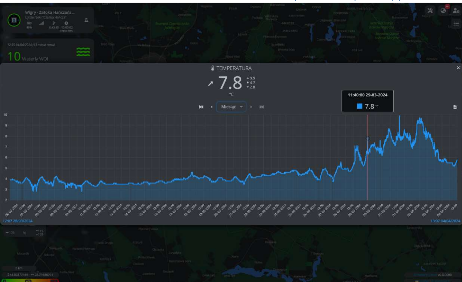
Prezentacja danych historycznych w aplikacji Waterly.